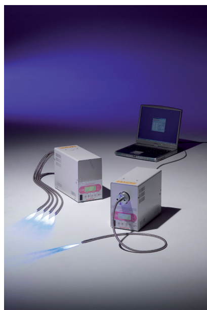
Sources Xenon Mercure à large spectre

D'autres produits, comme les lampes deutérium, sont conçus en technologie de tubes sous vide et répondent aux applications allant plus loin dans l'UV. Les produits classiques, à base de Mercure Xénon continu avec multi-fibres et différentes optiques, sont également disponibles.