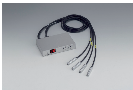
Sources à LED ponctuelles